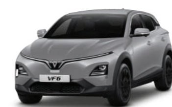
Xám - Zenith Grey