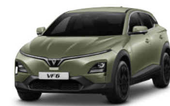
Xanh Lá Nhọt - Urban Mint