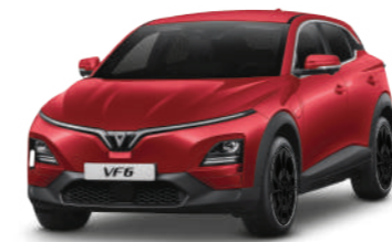
Đỏ - Solar Ruby