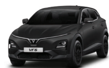
Đen - Jet Black