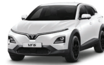
Trắng - Infinity Blanc